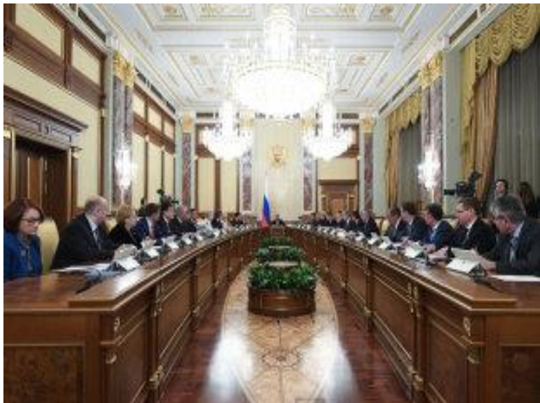
Медведев рассказал куда пойдут 62 млрд рублей допрасходов бюджета - 2018

Президент России Владимир Путин распорядился создать автономную некоммерческую организацию «Россия - страна возможностей». Соответствующий указ был подписан 22.05.2018 года главой государства. Новая организация объединит все проекты, входящие в одноименную открытую платформу. Одним из проектов платформы является движение «Абилимпикс» , помимо него сейчас в нее входят еще 13 проектов.